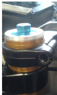
Piastra di sterzo Aprilia Aprilia top fork bridge

L'ufficio tecnico è a disposizione per qualsiasi ulteriore informazione.