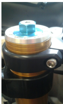
Piastra di sterzo Melotti Racing Melotti Racing top fork bridge

Extraction to be detected with Melotti Racing top fork bridge: 9.7 mm